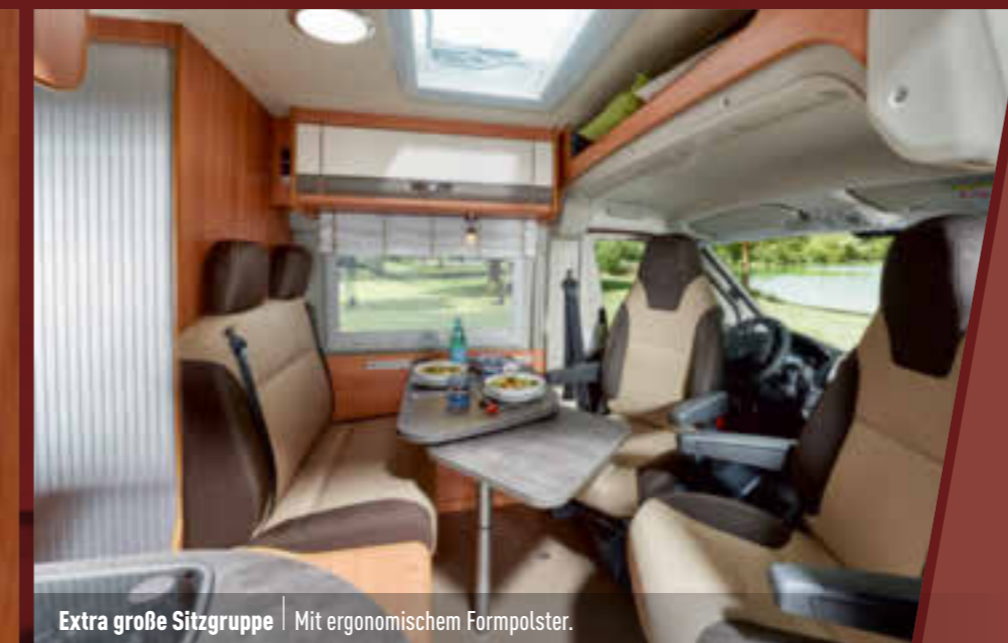
Extra große Sitzgruppe | Mit ergonomischem Formpolster.