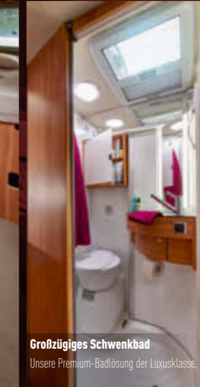
Großzügiges Schwenkbad Unsere Premium-Badlösung der Luxusklasse.