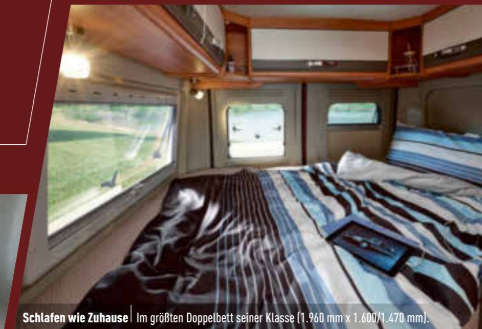
Schlafen wie Zuhause | Im größten Doppelbett seiner Klasse (1.960 mm x 1.600/1.470 mm).