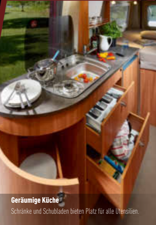
Geräumige Küche Schränke und Schubladen bieten Platz für alle Utensilien.